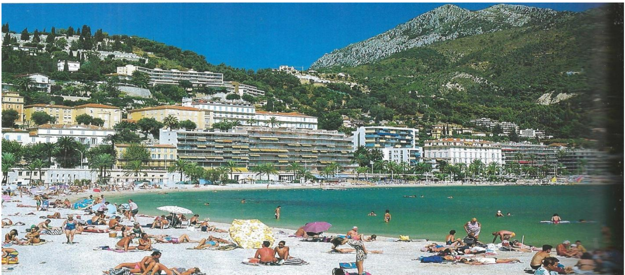
Des touristes à Menton.