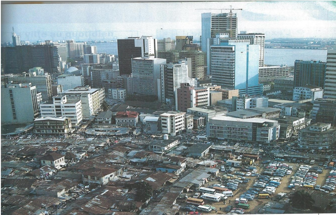
Lagos, le quartier des affaires.

« Villes africaines », La Documentation photographique, juin 1999.