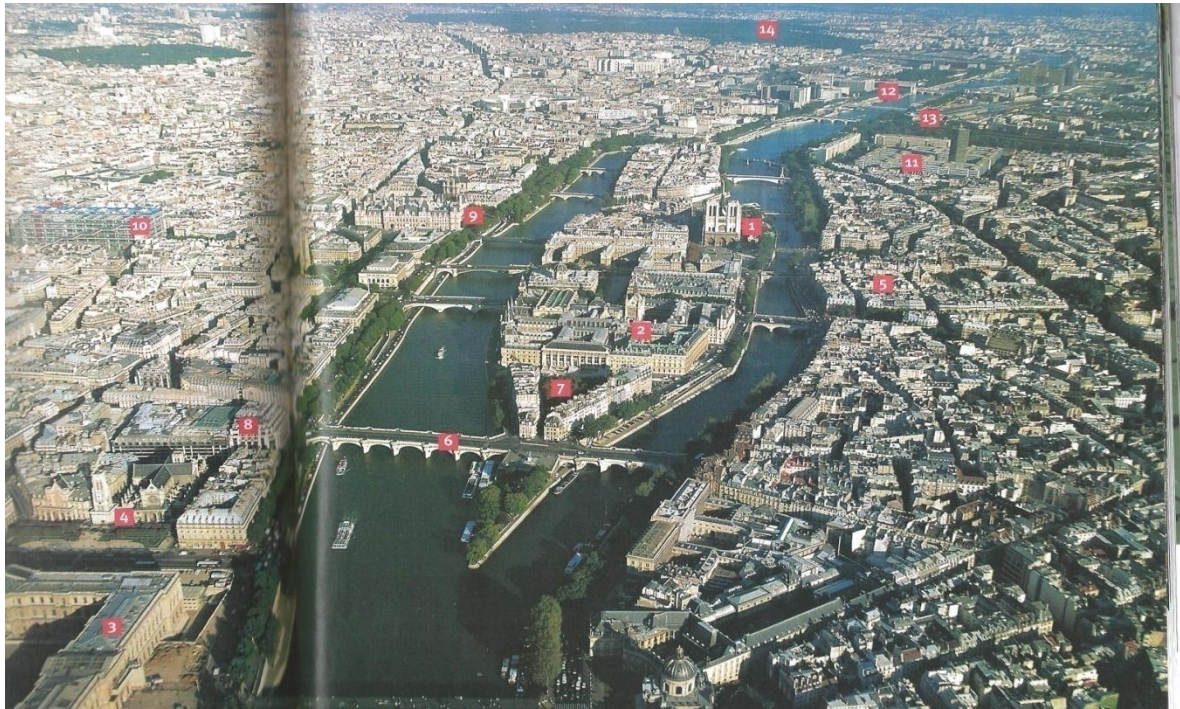
La ville de Paris.